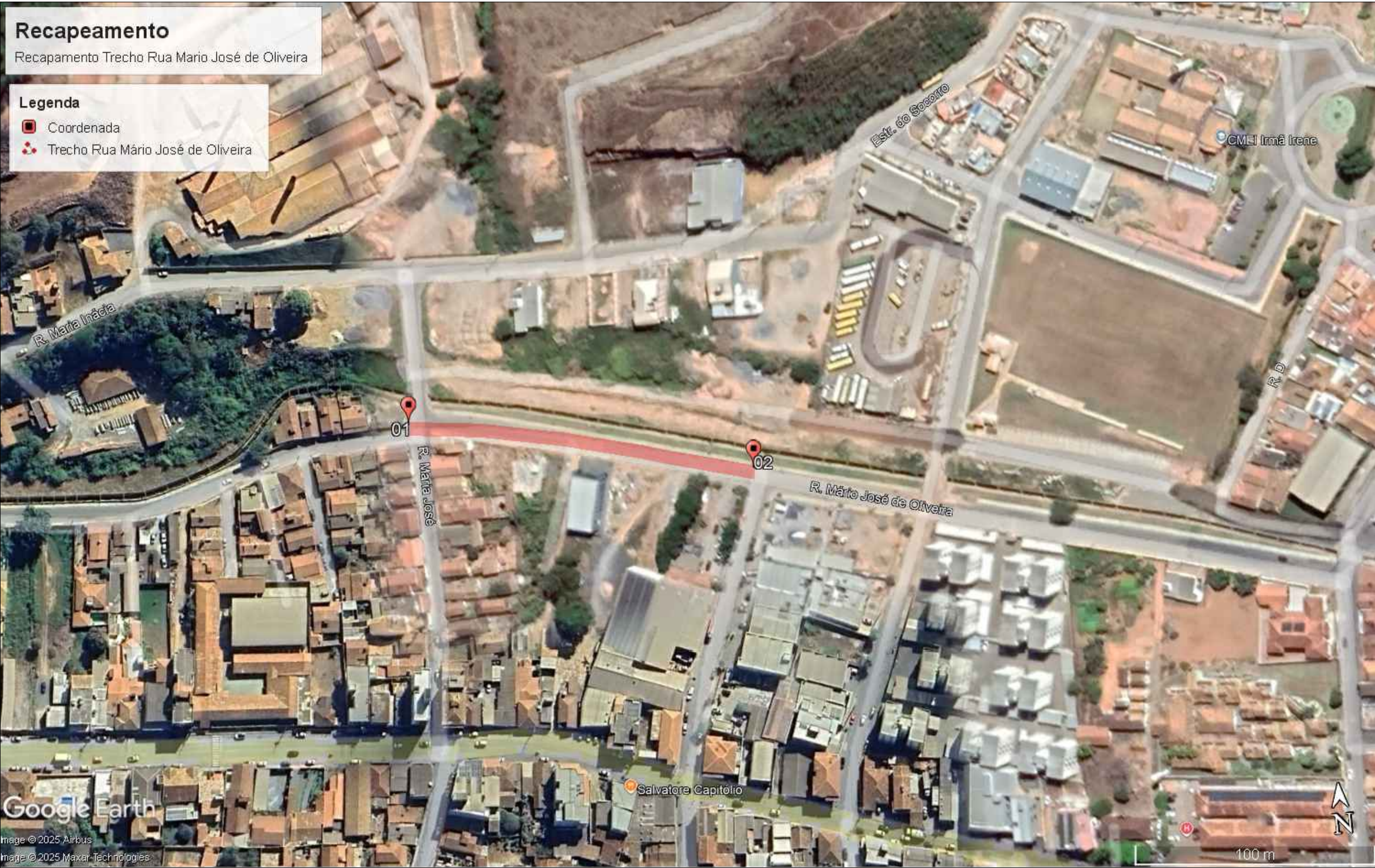
LOCALIZAÇÃO-TRECHO RUA MARIO JOSE DE OLIVEIRA SEM ESCALA

TRECHO - RUA MARIO JOSÉ DE OLIVEIRA ESCALA 1:250